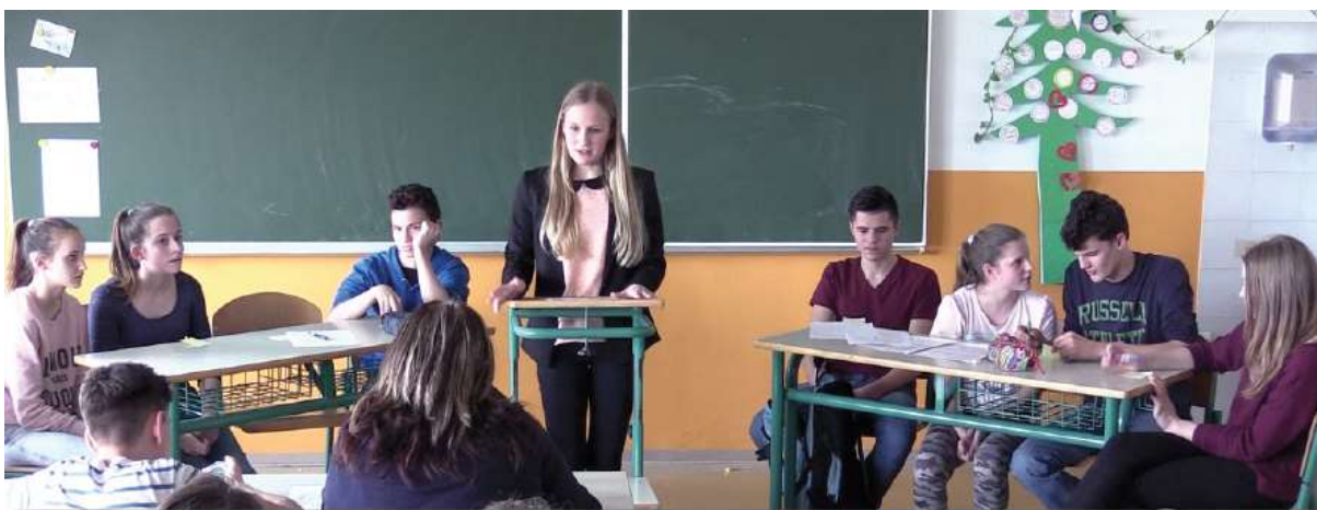
Debata na téma Slova mají obrovskou sílu, 8. A 9. třída, Základní škola Smihel

Diskuse je činnost, která je charakterizována hašteřivou a organizovanou výměnou názorů dvou protichůdných týmů. Každá rozprava probíhá v souladu s určitými pravidly. Diskutující dostanou tvrzení, o kterém diskutují. Pak diskutující zkoumají dané téma diskuze a shromažďují argumenty a podpůrná fakta pro tyto argumenty. Ve škole se může diskuse provádět v rámci hodiny jako motivace pro určitou činnost nebo jako soutěž. Diskuse je příležitostí pro studenty získat rétorické dovednosti, cvičit se v rychlém myšlení, dobrém poslechu a rychlém utváření myšlenek. Tyto dovednosti jsou velmi důležité, protože žáci musí odmítnout prohlášení oponenta. Diskuse navíc učí, aby byli zodpovědnými řečníky, protože nemohou používat prázdné fráze a nepodložené argumenty.