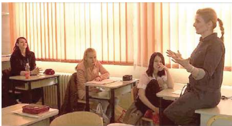
Základní škola Jelenia, Slovensko

Všechny pokyny uváděné pro studenty mohou být aplikovány při veřejném vystupování rovněž dospělými.