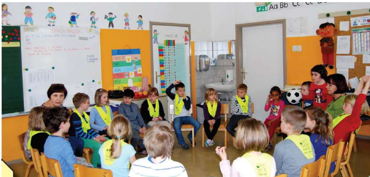
Ranní kruh, 1. třída, Základní Smihel