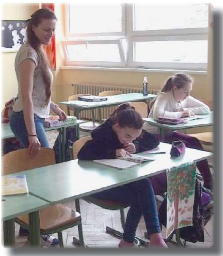
Základní škola Jelenia, Slovensko